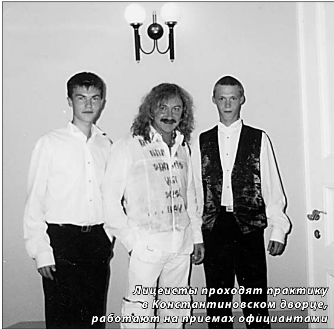
Лицейисты проходят практику в Константиновском дворце, работают на приемах официантами