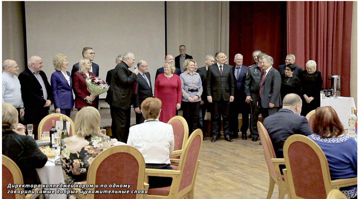
Директора колледжей хором и по одному говорили самые добрые и уважительные слова

Мы много раз писали об «Автомобильном колледже» — одном из лучших