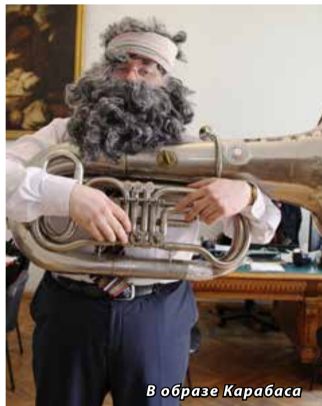
В образе Карабаса