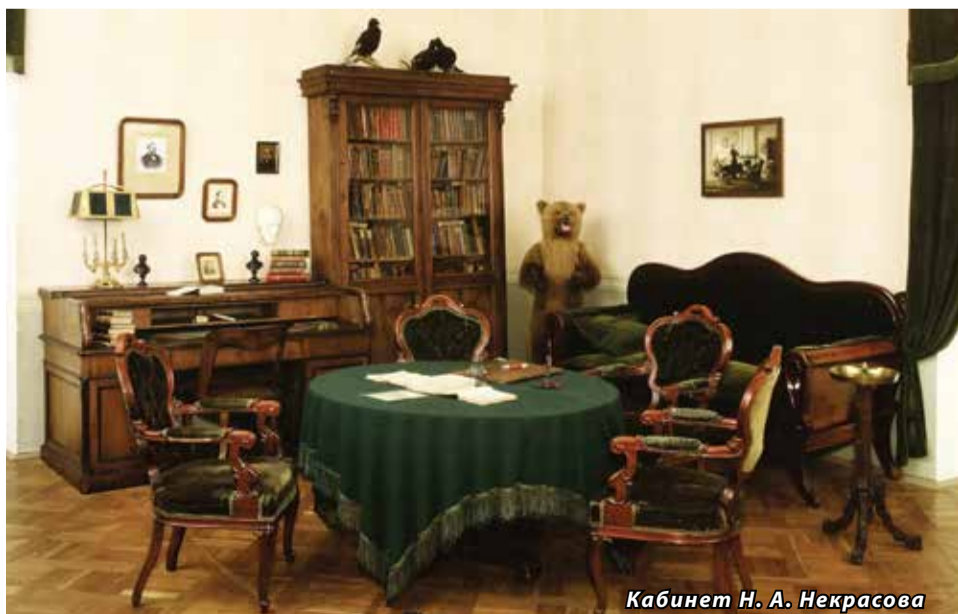
Кабинет Н. А. Некрасова