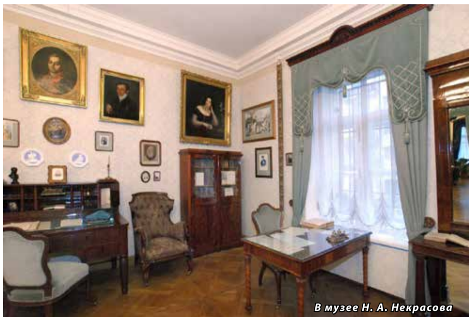
В музее Н. А. Некрасова

От редактора: а в конце января Музей-квартира Н. А. Некрасова откроется после ремонта.