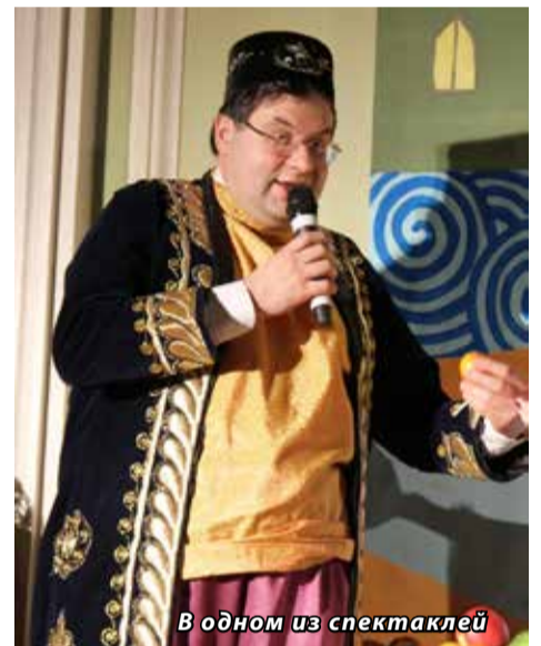
В одном из спектаклей