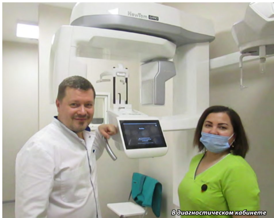
В диагностическом кабинете

Обращаются за протезированием люди зрелого возраста, накопившие некоторые заболевания. Тут надо обязательно сказать, что всё зависит от состояния человека и степени того или иного заболевания. Вот, например, пациент с диабетом. Если компенсированный диабет, поддержанный лекарствами, которые помогают не развиваться болезни, имплантаты показаны. Всё зависит от умения и желания врача думать, как помочь (лечить) такого пациента. Помните, что пациент платит ему не за то, какой он шуруп в десну вкрутил, а за то, что доктор изучает объёмы костной структуры, по какой методике вести пациента, есть ли системные заболевания и насколько они выражены. Никогда нельзя идти на поводу у пациента, когда он говорит, что всю ответственность берёт на себя. Грамотный доктор, опытный доктор никогда не будет вредить пациенту. Ко мне пришла пациентка с острым ревматизмом, которая сбежала из стационара на несколько часов ко мне на приём (у неё, видите ли, свободное время!), решила ставить имплантаты. Конечно, я её отправил обратно.