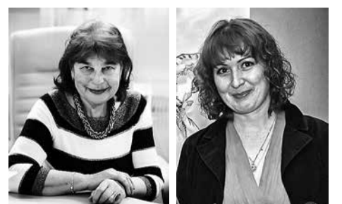
Все материалы номера готовит Регина АЗЕРАН

Напомним, планы по проведению военного парада на Дворцовой площади 27 января показались многим петербуржцам неуместными. Жители города направили коллективное обращение Александру Беглову с просьбой отказать от проведения парада в этот день.