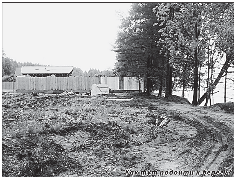
Как тут подойти к берегу?