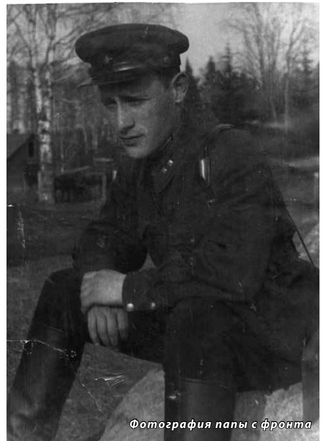
Фотография папы с фронта