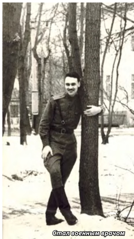
Стал военным врачом