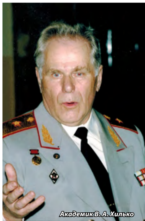
Академик В. А. Хилько