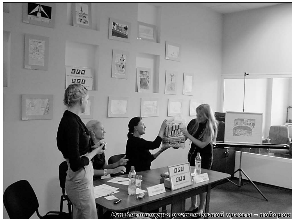
От Института региональной прессы – подарок

Также вы можете перевести средства на расчетный счет фонда-организатора и тем самым стать участником закупки канц.товаров, которые отправляются в Гатчинскую школу-интернат, в которой проживают 77 детей.