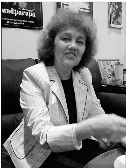
(Окончание. Начало на стр. 1)