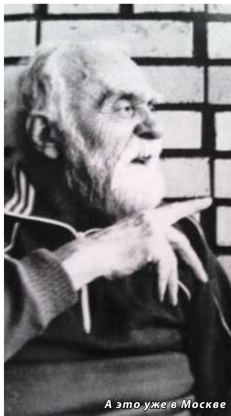
А это уже в Москве

В этом году «ровесники» XX века отметят своё 115-летие. На рубеже веков появилась целая плеяда талантливых людей: певцы Иван Семёнович Козловский, Пантелеймон Маркович Норцов, Лидия Андреевна Русланова, литераторы Николай Робертович Эрдман, Лев Васильевич Успенский, Всеволод Витальевич Вишневский, Виктор Ефимович Ардов, артисты Осип Наумович Абдулов, Мария Ивановна Бабанова, Дмитрий Николаевич Журавлёв, и Фёдор Михайлович Никитин. Его киноведы называют «великая звезда великого немого». Вспомним хотя бы «Парижский сапожник» или «Обломок империи».