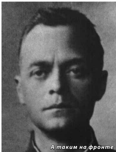
А таким на фронте