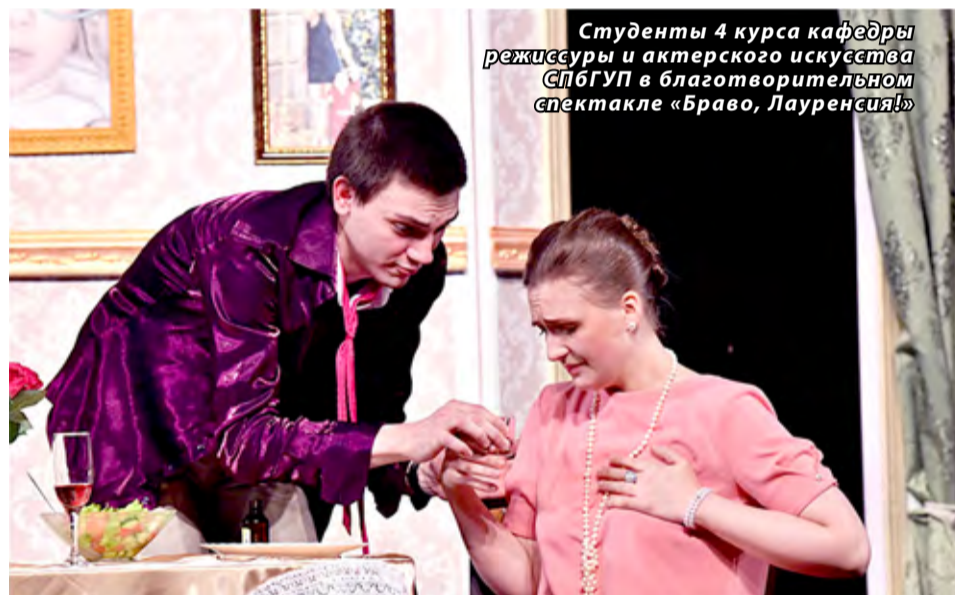
Студенты 4 курса кафедры режиссуры и актерского искусства СПбГУП в благотворительном спектакле «Браво, Лауренсия!»