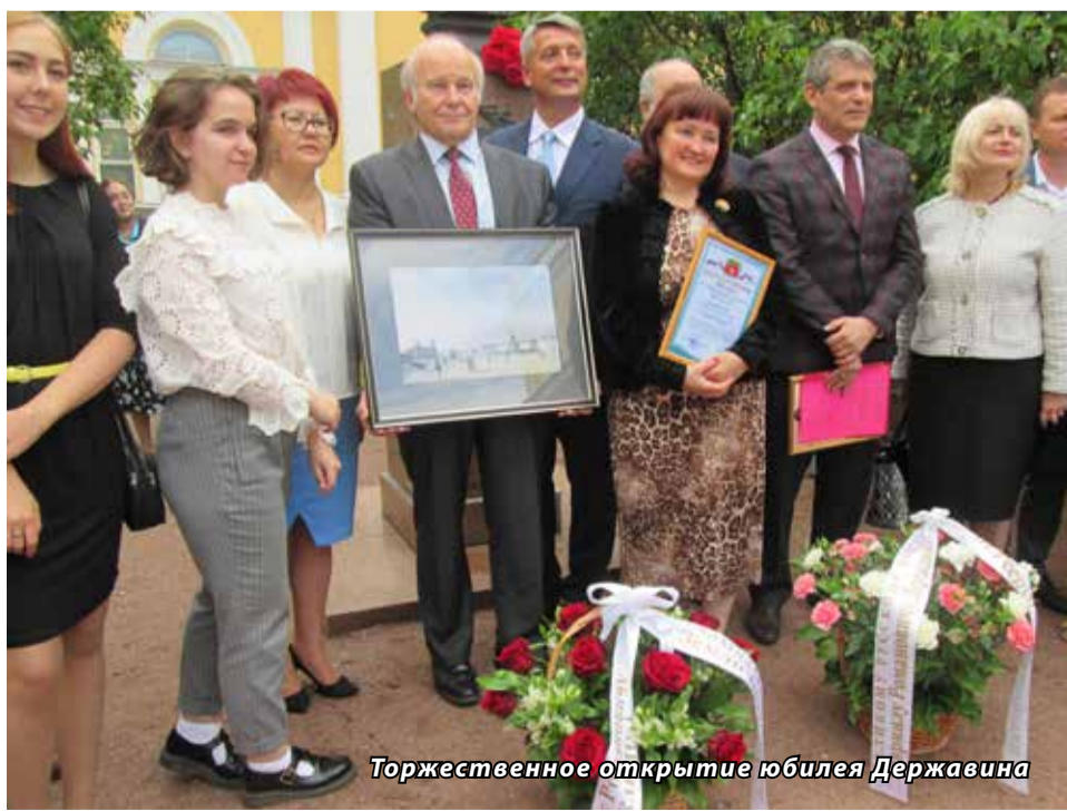
Торжественное открытие юбилея Державина