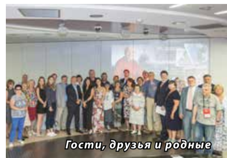
Гости, друзья и родные

В некрологе отмечено: «Одна жизнь, а вместила в себя столько, что хватило бы на все десять. Человек широчайшего диапазона, которого интересовало всё по-настоящему неординарное, талантливое в нашем народе. Ценой своей жизни в холодном и голодном