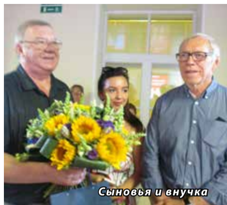
Сыновья и внучка