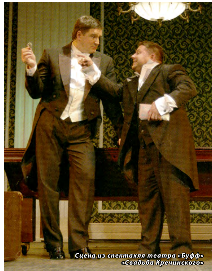
Сцена из спектакля театра «Буфф» «Свадьба Кречинского»

Конечно, искусство это не математика. Здесь нет точного отсчёта. Одному нравятся блондинки, другому брюнетки. Конечно, талантливые последователи Таирова, Мейерхольда могут глубоко мысль автора ярко показать. Интеллектуальные зрители-театралы их понимают. Но факт остаётся фактом, к сожалению их не так много. И нет сейчас тех переполненных залов даже у таких режиссёров.