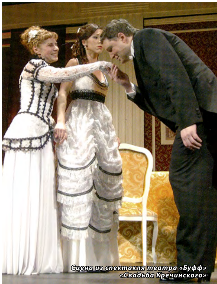
Сцена из спектакля театра «Буфф» «Свадьба Кречинского»

— Видимо, они не знают, как в названные мной театры ленинградцы стремились попасть. Ночами стояли в очереди за билетами. Они не знают, как наше поколение школьников благодаря книге и театру стремилось к творчеству и интересно развивалось.