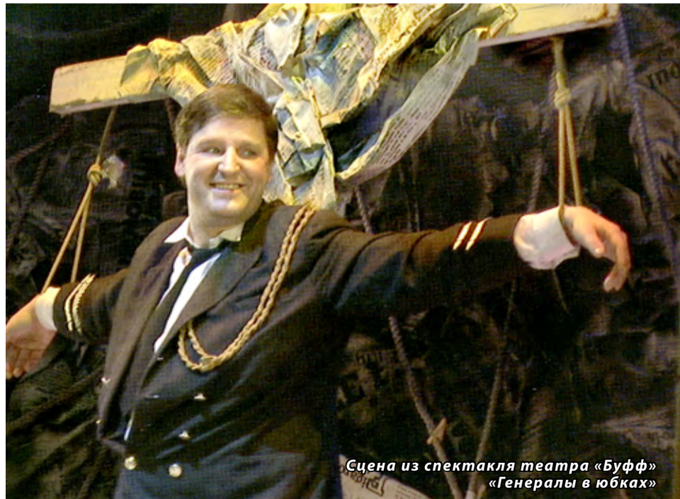
Сцена из спектакля театра «Буфф» «Генералы в юбках»

Р. С. А далее мы говорили о воспитании детей, о спектаклях для детей, о молодёжной культуре, о воспитании молодых актёров. Но этот разговор — в следующем номере нашей газеты.