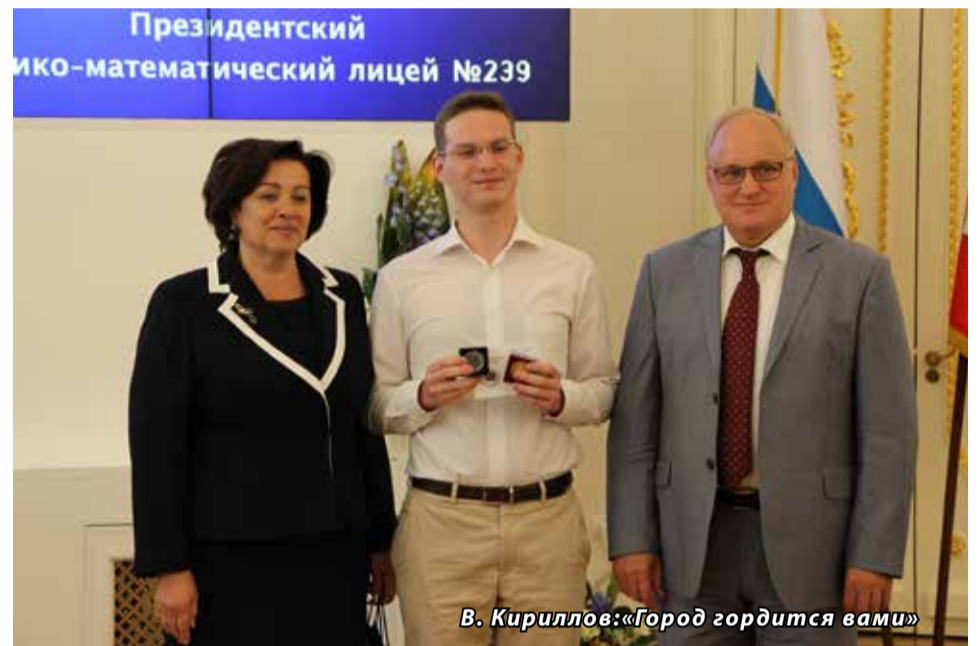
В. Кириллов: «Город гордится вами!»

Дорогие выпускники! В эти знаменательные дни счастливых пожеланий я позволю себе вам напомнить.