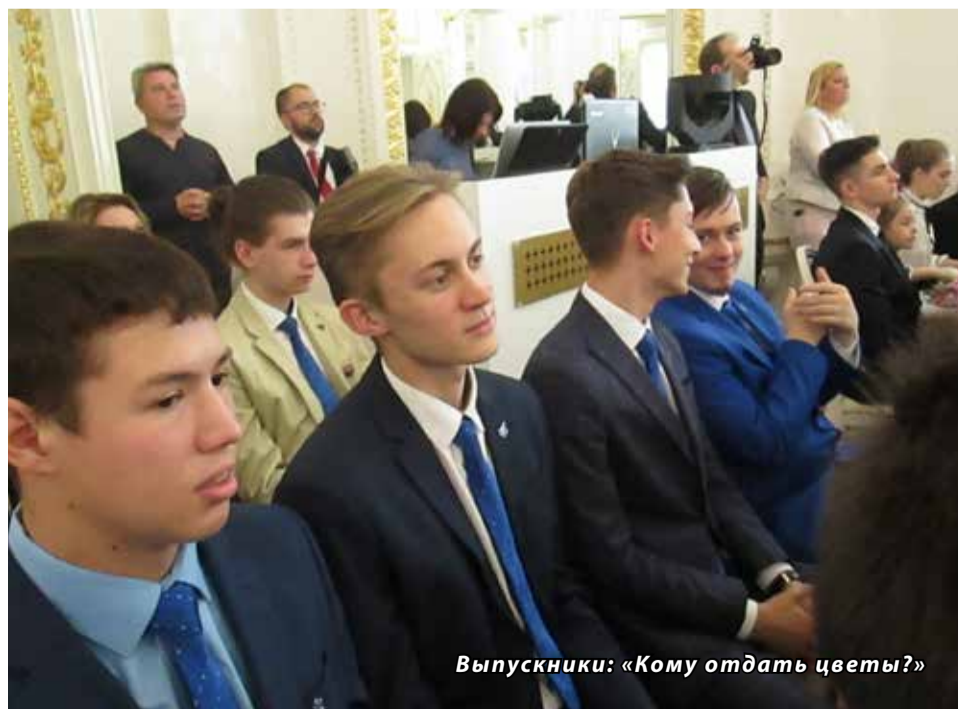
Выпускники: «Кому отдать цветы?»