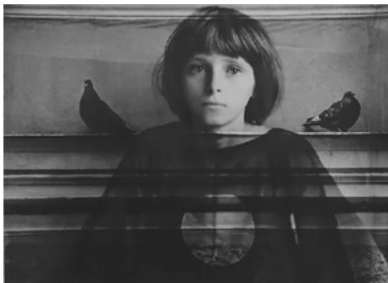
Портрет с голубями. 2008 г.

Творческое наследие Виктора Ильина стоит особняком в петербургской фотографии. В его работах зритель не найдет знаковых видов города. Его художественное видение мира было сформировано просторами Казахстана и Киргизии, в окружении которых он прожил значительную часть своей жизни. Именно география оказала влияние на творчество Ильина. Его фотоснимки едва насыщены событийностью, но на них всегда широко распахнуты земля и небо. Многочислен-