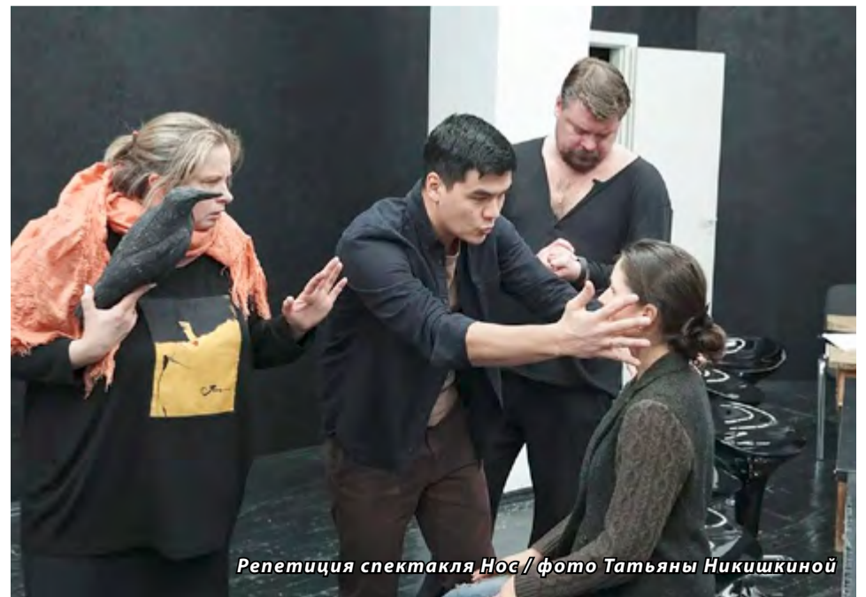
Репетиция спектакля Нос