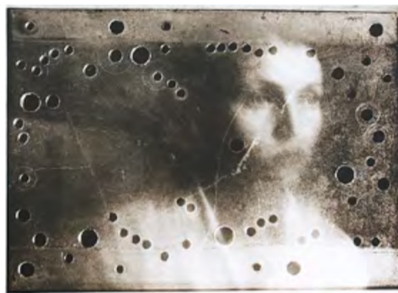
Неубиваемая память. 2007 г.