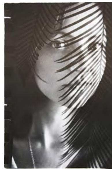
Пальмовый портрет. 2010 г.