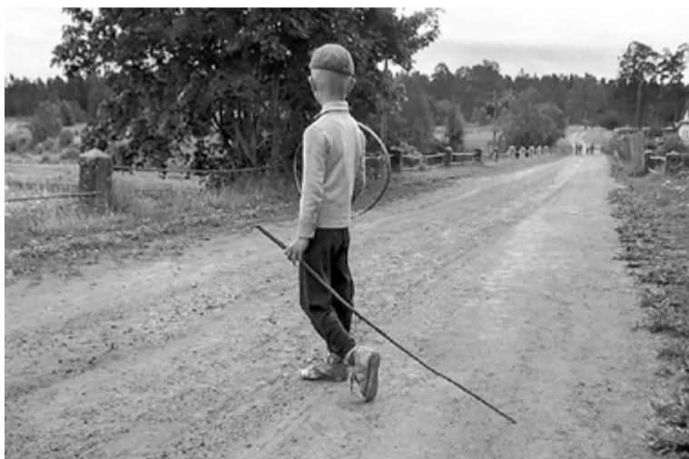
В начале пути. 1993 г.

ные портретные работы, героями которых зачастую выступают близкие Ильину люди, наряду с пейзажем остаются основой для творческих поисков фотографа.