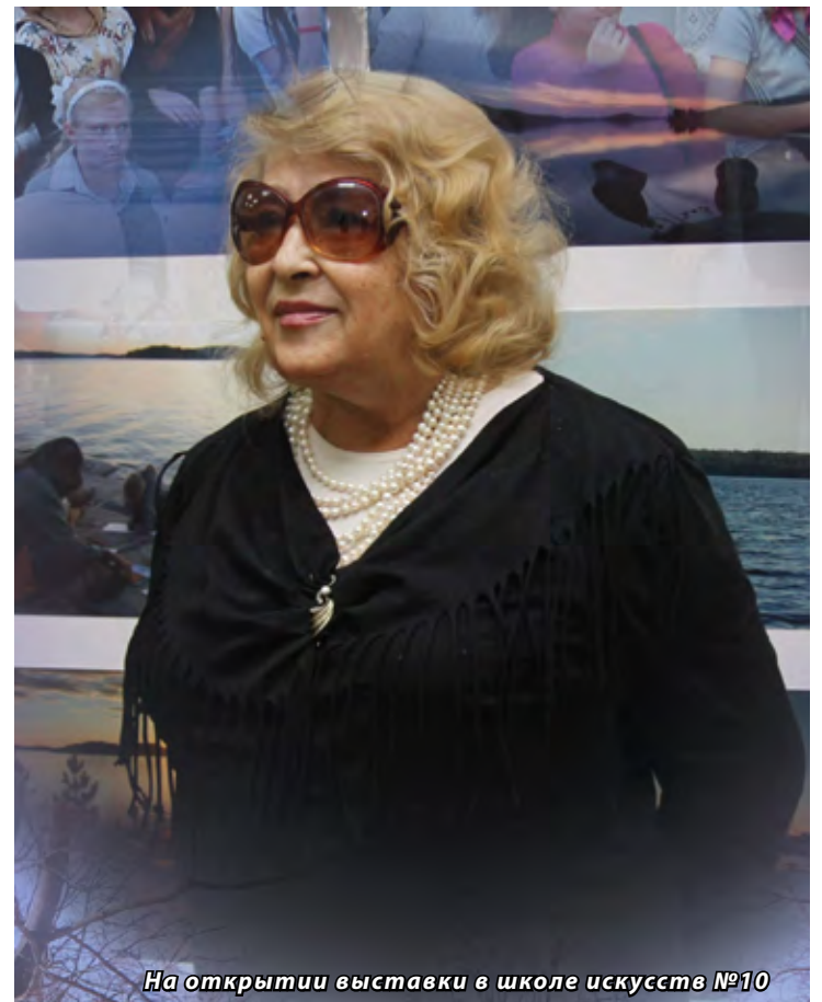
На открытии выставки в школе искусств №10

на первый план. Я видела, как и взрослые, и дети слушают с особым вниманием её рассказы о странах, где мы находились.