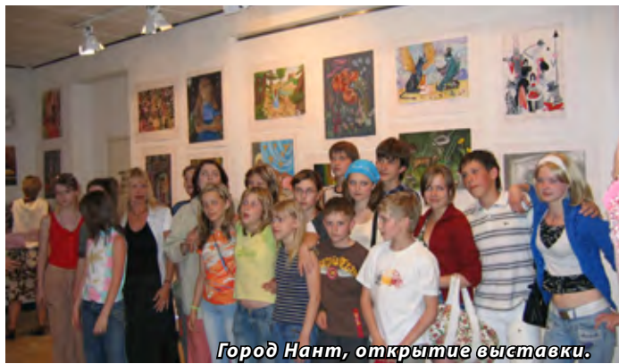
Город Нант, открытие выставки.