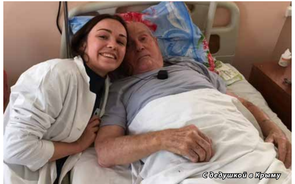
С дедушкой в Крыму

— Мне кажется, сегодня каждому стойкость надо в себе тренировать. Стойко держать слово и выполнять обещания. Честно относиться к делу. Мне кажется, честность, равносильна стойкости. Честностью можно в себе воспитать стоицизм.