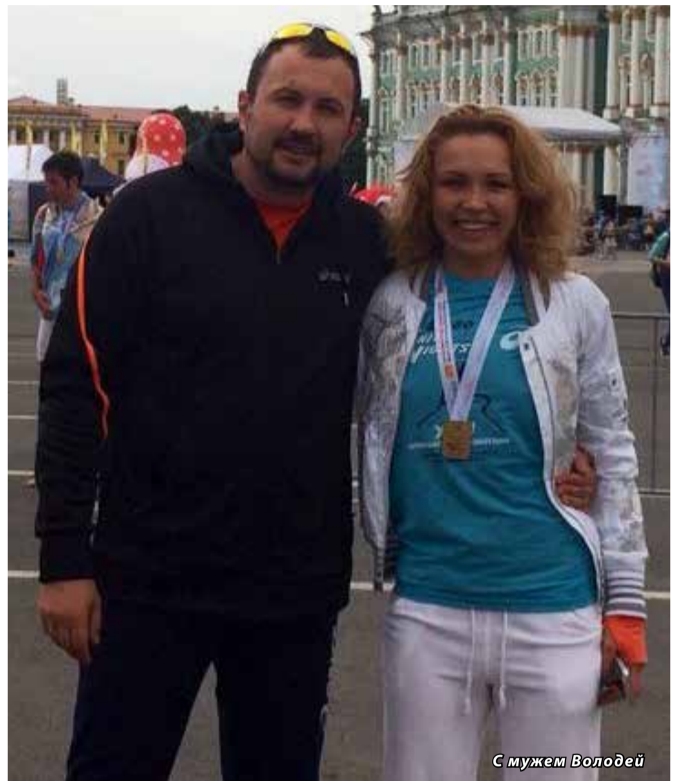
С мужем Володи

Таковыми были ленинградцы. Если бы не пример стоицизма ленинградцев-блокадников, сегодня бы люди не бросились на защиту города от терроризма. Они защитили город тем, что кинулись всех спасать в метро, не думая о себе. А потом все вышли на митинг. Этот город — моя икона! Здесь надо воспитывать в себе стойкость и интеллигентность».