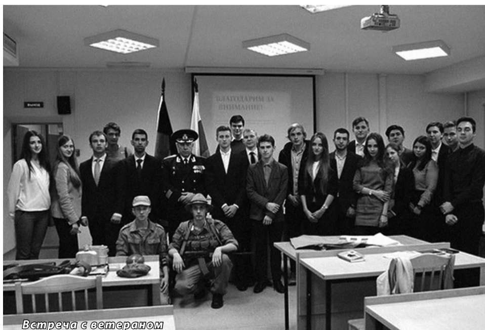
Встреча с ветераном