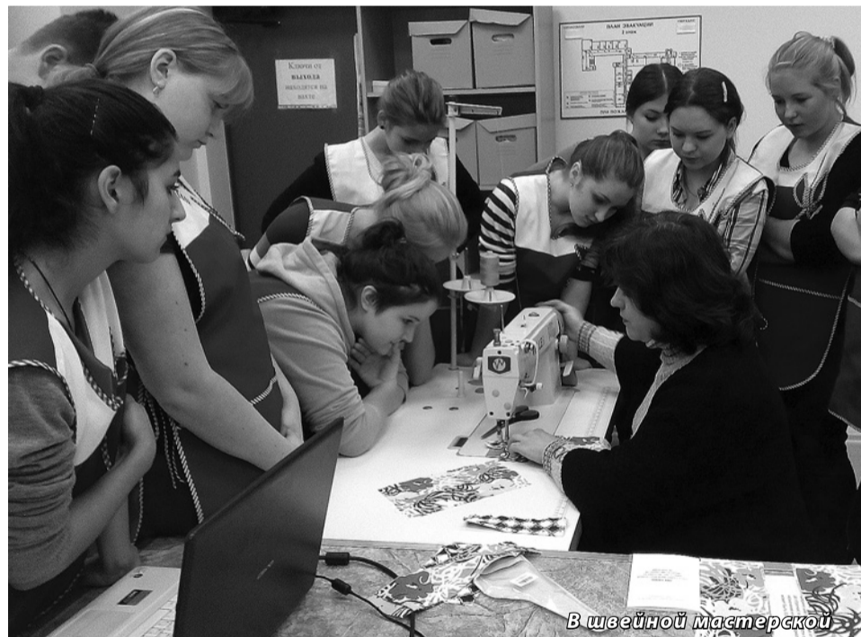
В швейной мастерской