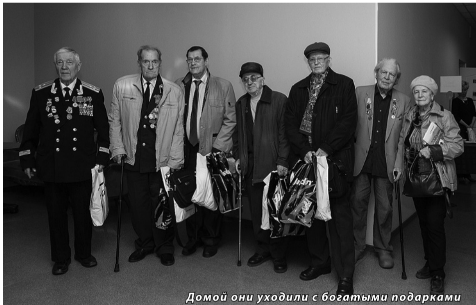
Домой они уходили с богатыми подарками