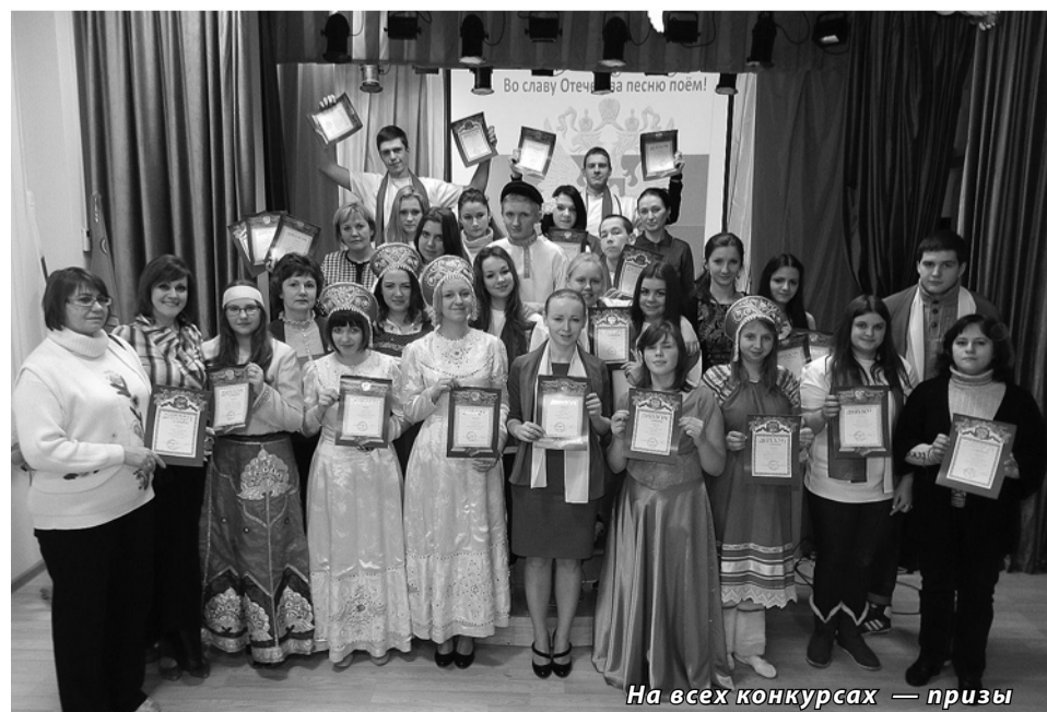
На всех конкурсах — призы