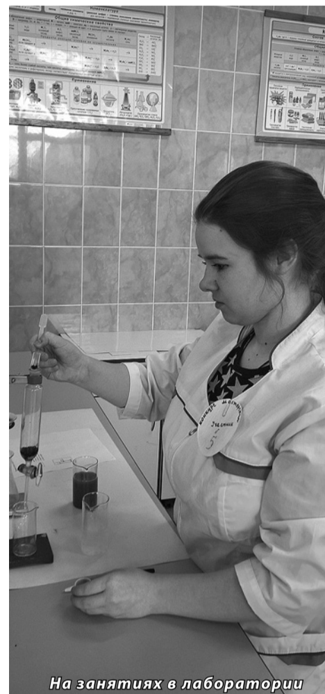
На занятиях в лаборатории

У колледжа есть еще два здания, где расположились Структурное подразделение «Детский дом», мастерские, «Ресурсный центр».