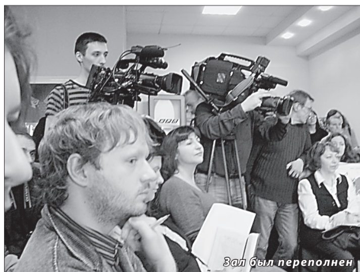
Зал был переполнен