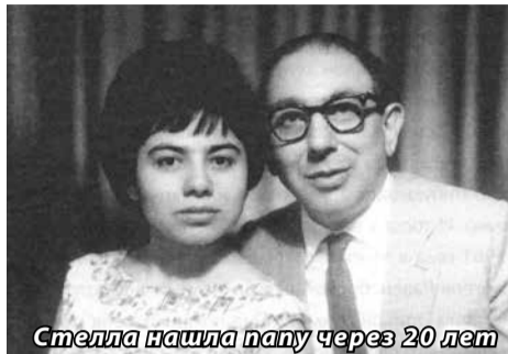
Стелла нашла папу через 20 лет