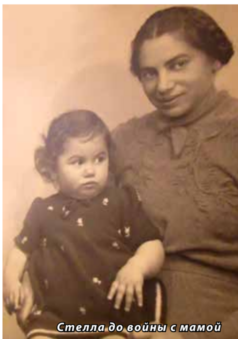
Стелла до войны с мамой

Книга «Горькое счастье» — её исповедь. Исповедь женщины в прозе и в стихах, оказавшейся в 1943 году ребёнком в одном из самых страшных фашистских женских концлагерей — Равенсбрюк, где в день уничтожали 250–400 человек. О нём писали: «То, что пережили там