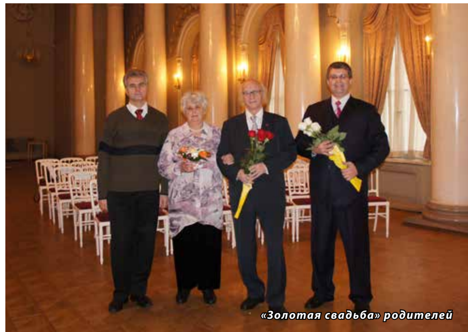
«Золотая свадьба» родителей