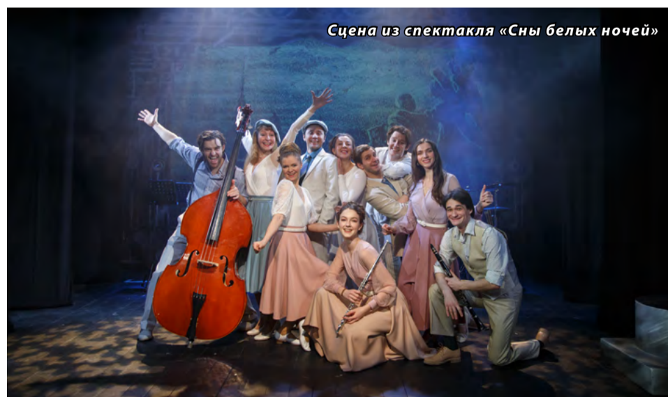
Сцена из спектакля «Сны белых ночей»