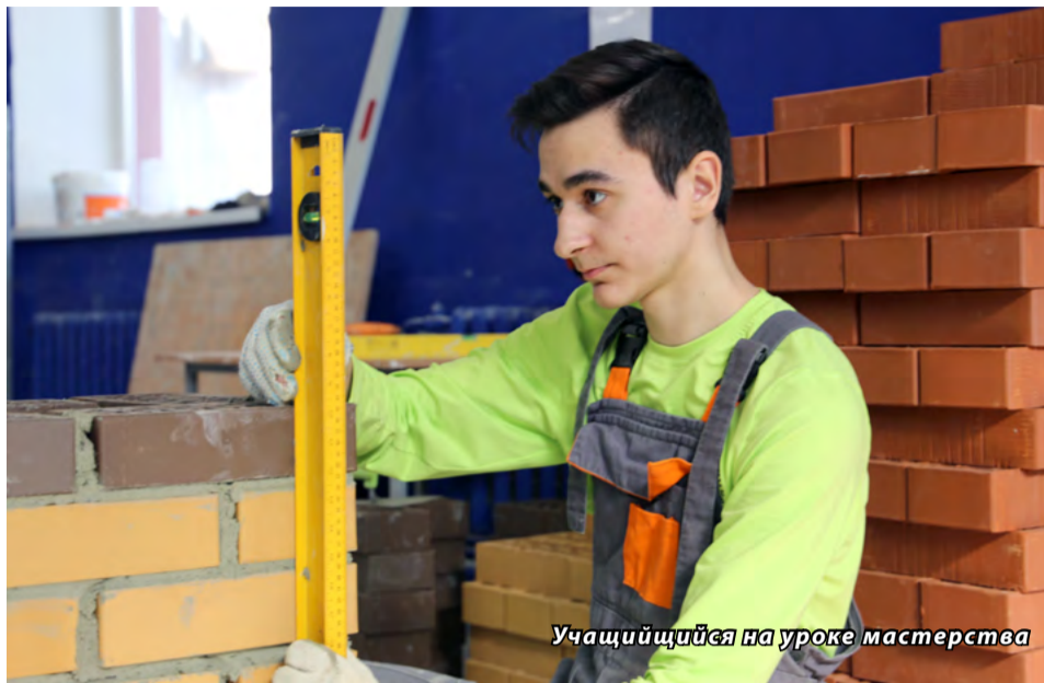
Учащийся на уроке мастерства

Идею строительства метро, возникшую накануне войны, не дала осуществить Великая Отечественная война. После войны не хватало рабочих везде, особенно в строительстве. Тогда и появилась школа ФЗО-26, первые выпускники которой гордились тем, что участвовали в строительстве первой ветки ленинградского метро. Их радовало, что они помогают жить ленинградцам. А в 1963 году школа была переименована в профессионально-техническое училище № 66. И оно стало набирать, что называется, всё больше и больше баллов. Поэтому в 1995 году оно было переведено в статус лицея. В 1977 году для него был построен новый современный учебный корпус на ул. Демьяна Бедного, 21, где заведение