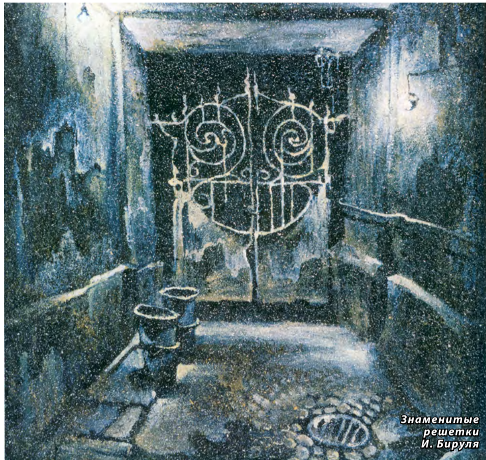
Знаменитые решетки И. Бируля

циями к сюжету этого спектакля. И будучи декоративным оформлением, полотно как бы удвоило ту мысль, те чувства, любовь к городу, которые автор вложила в них.