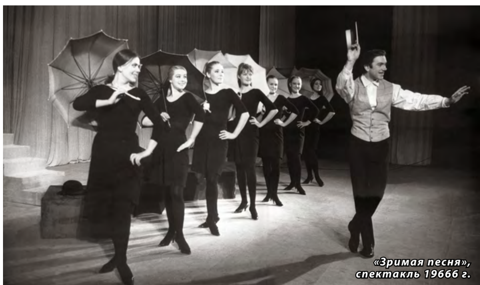
«Зримая песня», спектакль 1966 г.