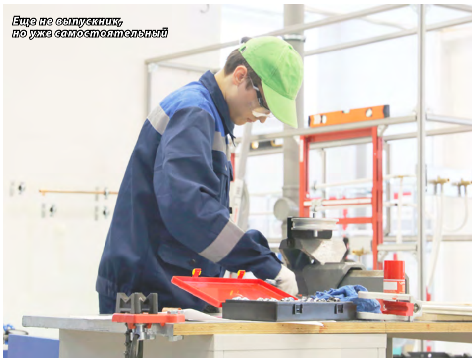
Ещё не выпускник, но уже самостоятельный