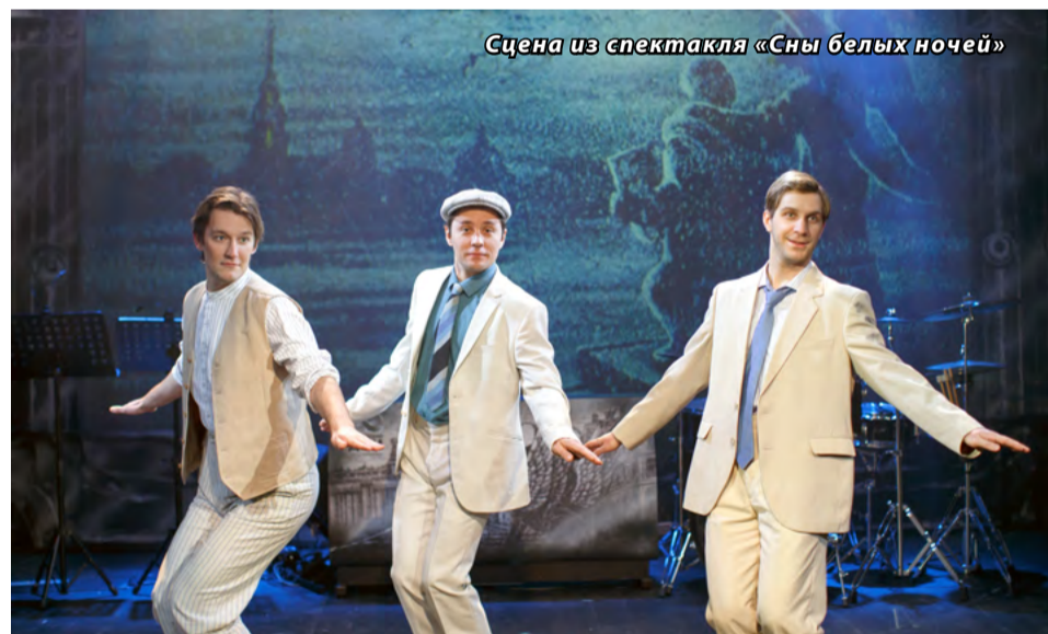
Сцена из спектакля «Сны белых ночей»