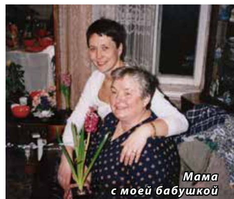
Мама с моей бабушкой