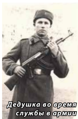
Дедушка во время службы в армии