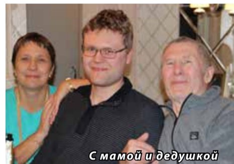
С мамой и дедушкой

— При окончании школы, двух вузов в Медицинском Университете и магистратуры Высшей школы экономики, получили везде золотые медали. Окончили и магистратуру юридического факультета нашего Главного универси-