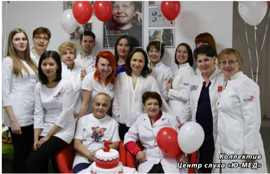
Коллектив Центр слуха «Ю-МЕД»

Согласно данным ВОЗ в настоящее время РАЗНООБРАЗНЫЕ НАРУШЕНИЯ ФУНКЦИИ СЛУХА, В ТОМ ЧИСЛЕ ПОЛНАЯ ГЛУХОТА НАБЛЮДАЕТСЯ У ТРЁХСОТ МИЛИОНОВ ЖИТЕЛЕЙ всей земли.