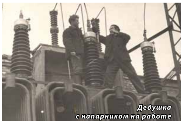
Дедушка с напарником на работе