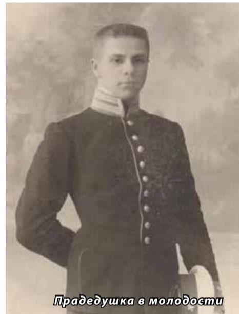
Прадедуська в молодости

тета. И параллельно выступали в судах. Как это вам удаётся?