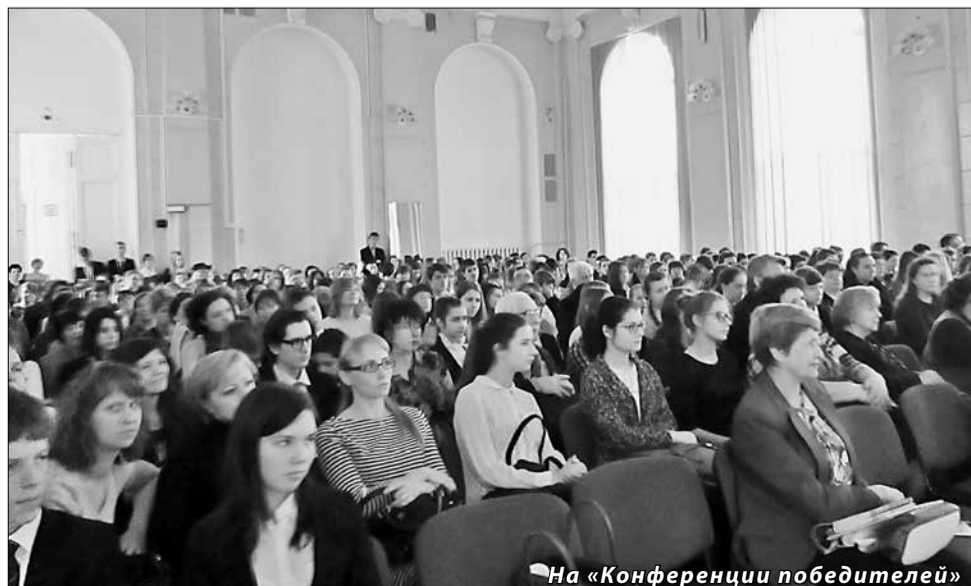
На «Конференции победителей»