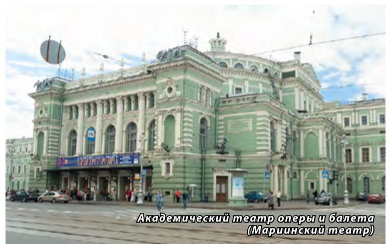
Академический театр оперы и балета (Мариинский театр)