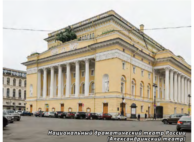
Национальный драматический театр России (Александринский театр)

На 2023 год запланировано более 60 театральных премьер. Так, в Михайловском театре планируются постановки «Раймонды», «Евгения Онегина» и «Кармен». Театр балета имени Леонида Якобсона ставит «Щелкунчика» и «Вечный дивертисмент. Вечер хореографии Леонида Якобсона». Театр балета Бориса Эйфмана представит премьеру балета «Преступление и наказание». Эти постановки в числе самых ожидаемых культурных событий в Петербурге в 2023 году.