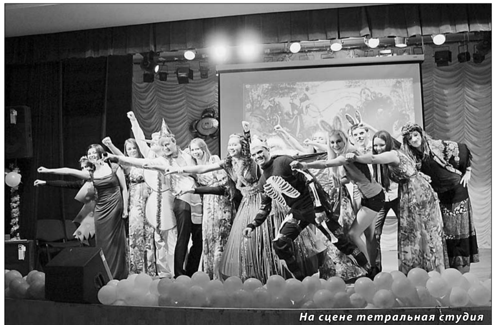
На сцене театральная студия