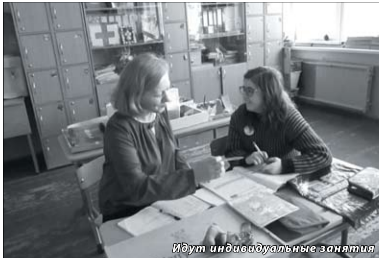
Идут индивидуальные занятия

ко справляется со всем этим хозяйством, но и, как говорят коллеги – педагоги: «Она готова каждый день приносить в школу интереснейшие творческие и хозяйственные идеи, увлекать ими так, что все рады воплотить их».