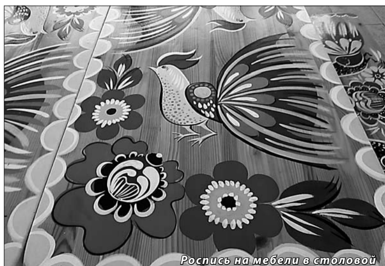
Роспись на мебели в столовой