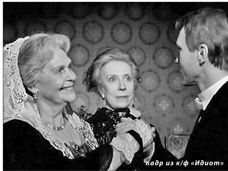
Кадр из к/ф «Идиот»