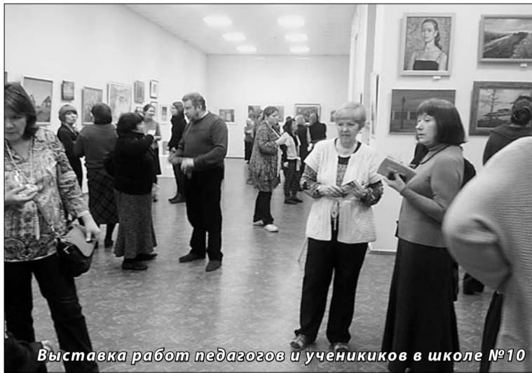
Выставка работ педагогов и учеников в школе №10

Члены жюри отметили главную тенденцию работ: «Юные художники отошли от стандартов восприятия исторической резиденции, продемонстрировав богатство фантазии и глубину мироощущения. Многие решили не изображать привычные символы, вроде «Самсона», сосредоточившись на других объектах. Кто-то намеренно сделал акцент на бытовании современного Петергофа: на гостях парка, и личном пребывании в музее-заповеднике. Дети