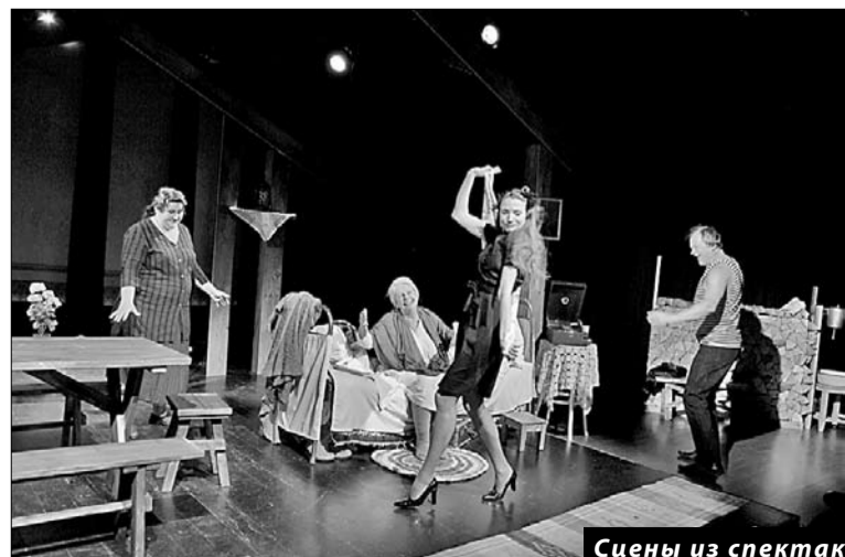
Сцены из спектакля «Последний срок»